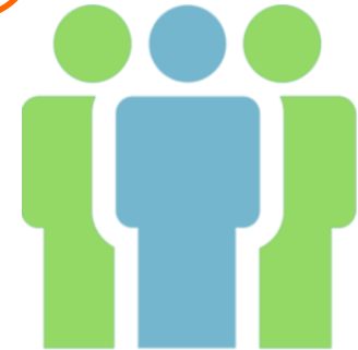
WP OP yang Melakukan Pembukuan