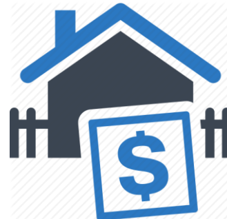
Bentuk Usaha Tetap

BELUM melakukan penilaian kembali pada saat permohonan