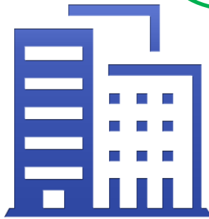
WP Badan Dalam Negeri

TELAH melakukan penilaian kembali pada saat permohonan